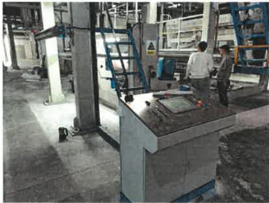
图 4 事故现场图