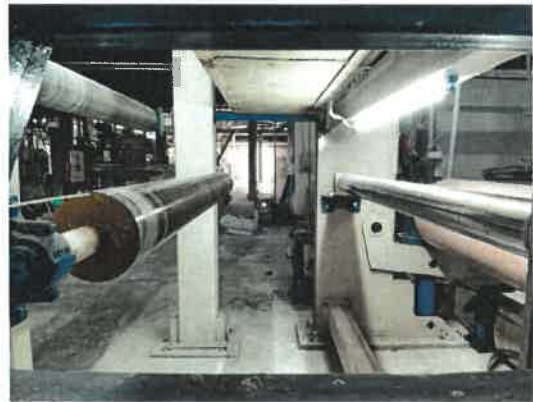
图 5 事故现场图