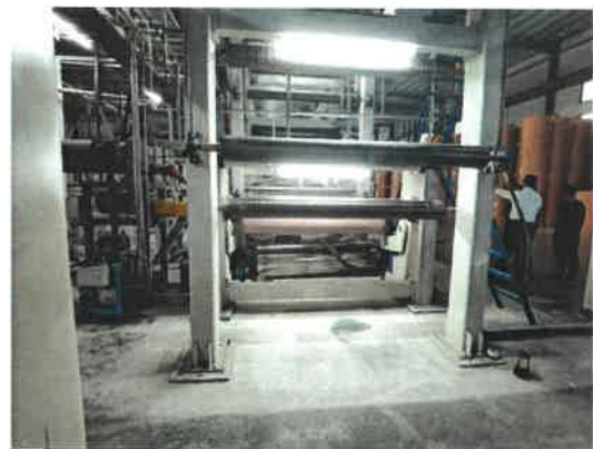
图 3 事故现场图