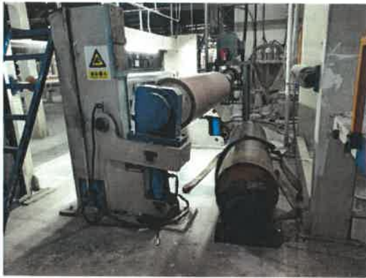
图 2 事故现场图

事故地点位于维某某公司涂布车间 3 号涂布生产线。现场勘察情况是：3 号涂布生产线已经全线停止，1 号压光机的压光辊已被拆卸至地面，田某已被送至连平县殡仪馆。事故现场图见图 2、图 3、图 4、图 5。